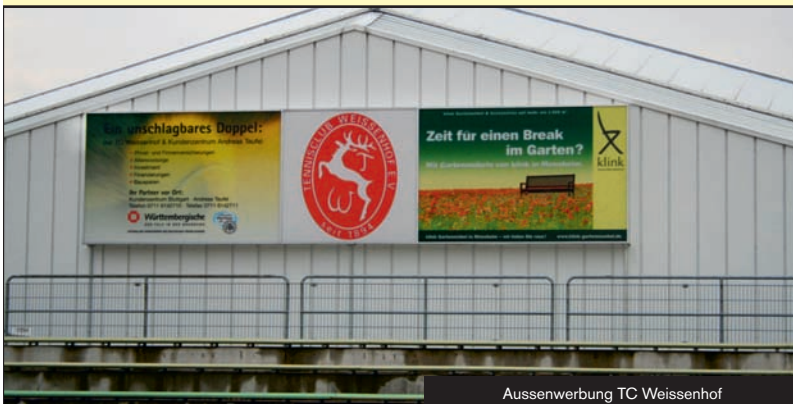
Aussenwerbung TC Weissenhof