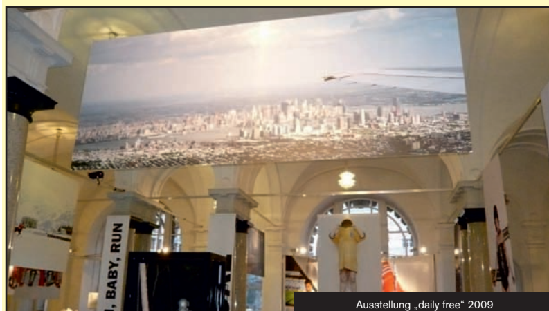
Ausstellung „daily free“ 2009